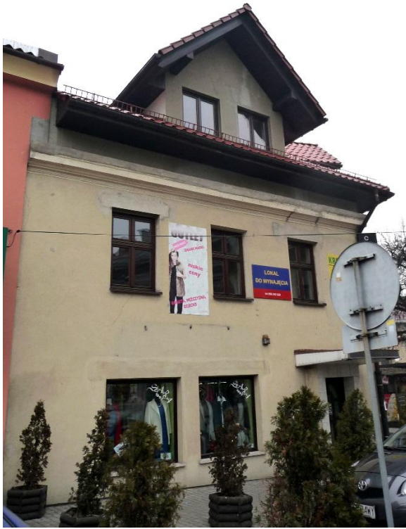
Zdjęcie wykonane w styczniu 2016 r.