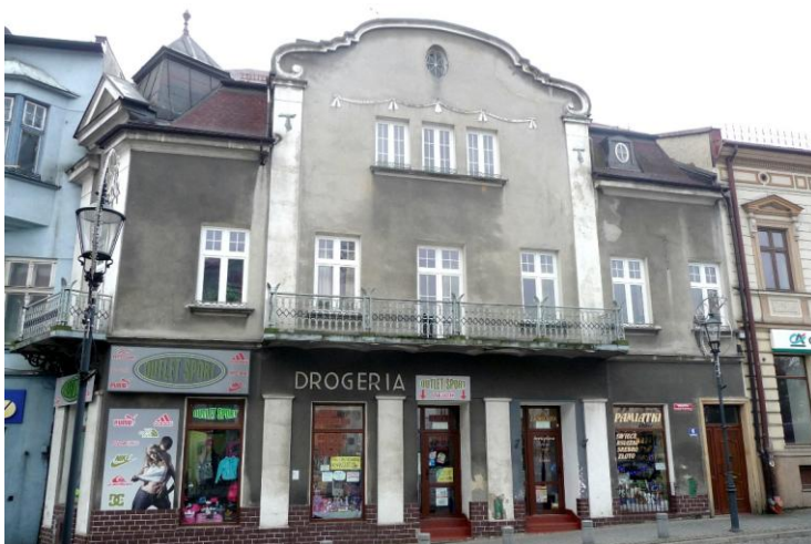
Zdjęcie wykonane w styczniu 2016 r.