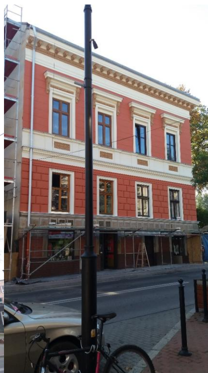
Zdjęcie wykonane w październiku 2017r. - po wykonanym remoncie