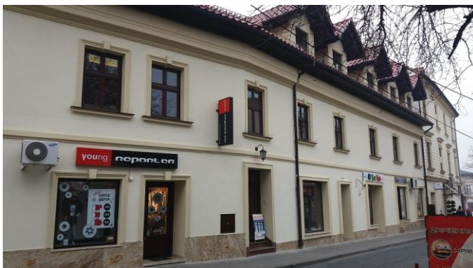
Zdjęcia wykonane w listopadzie 2016 r. - po remoncie