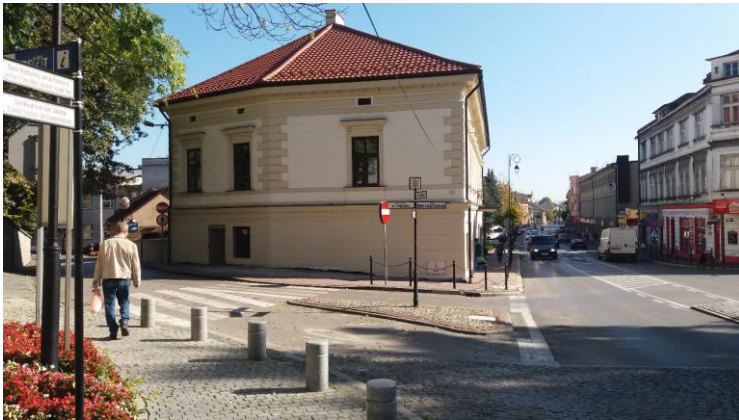
Zdjęcia wykonane w październiku 2017 r. - po wykonanym remoncie