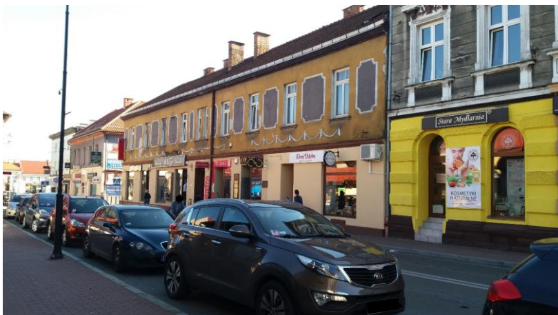
Zdjęcie wykonane w październiku 2017 r. - po wykonanym remoncie