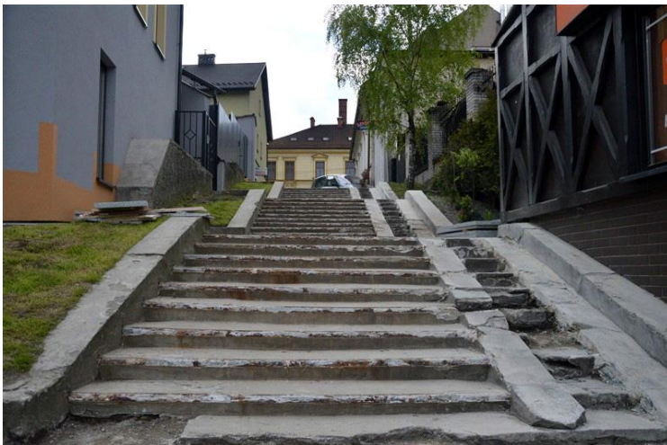
Zdjęcie wykonane w 2016 r.