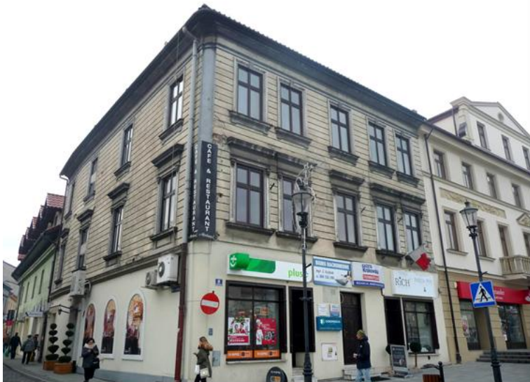
Zdjęcie wykonane w styczniu 2016 r.