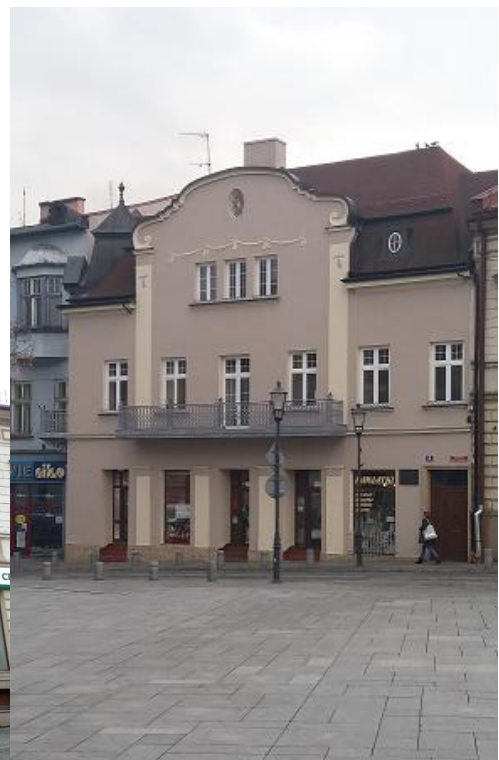
Zdjęcie wykonane w listopadzie 2016 r. - po remoncie