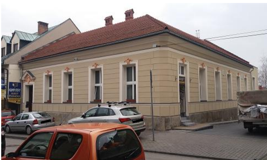
Zdjęcie wykonane w listopadzie 2016 r. - po wykonanym remoncie