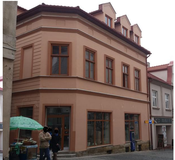
Zdjęcie wykonane w listopadzie 2016 r. - po wykonanym remoncie.