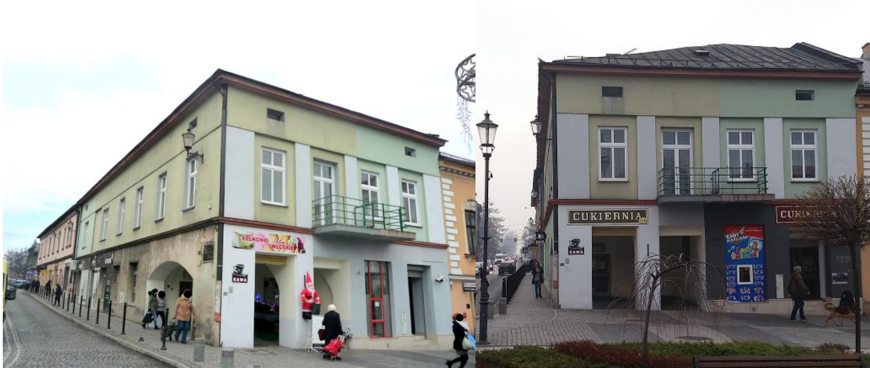
Zdjęcie wykonane w styczniu 2016 r. (obiekt nieujęty GEZ)