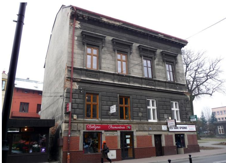
Zdjęcie wykonane w styczniu 2016 r.