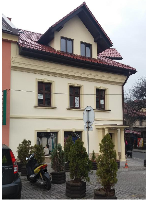
Zdjęcie wykonane w listopadzie 2016 r. - po remoncie