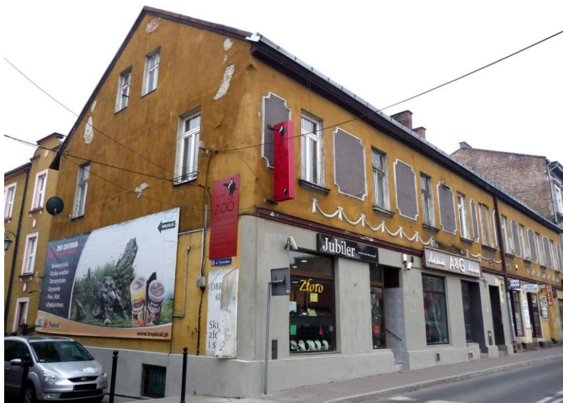
Zdjęcie wykonane w styczniu 2016 r.