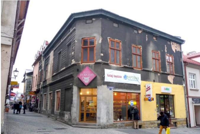
Zdjęcie wykonane w styczniu 2016 r.