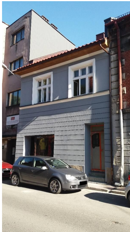
Zdjęcie wykonane w październiku 2017 r. - po wykonanym remoncie