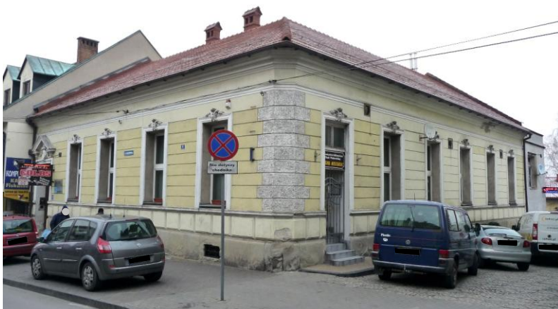
Zdjęcie wykonane w styczniu 2016 r.