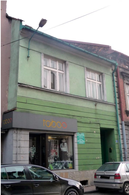
Zdjęcie wykonane w styczniu 2016 r.