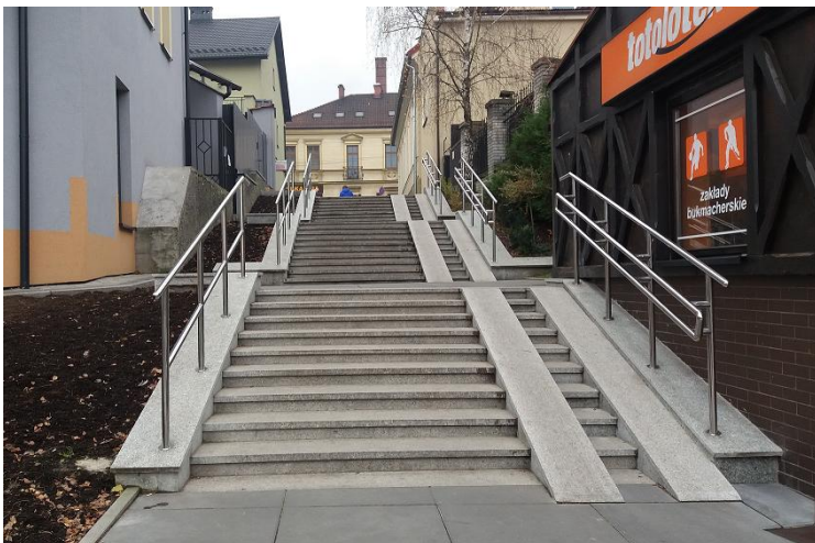
Zdjęcie wykonane w listopadzie 2016 r. - po wykonanym remoncie